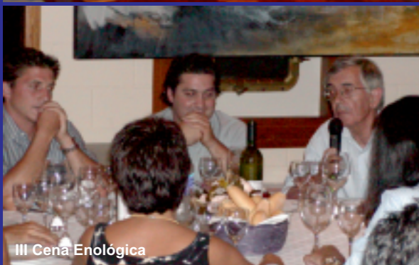
III Cena Enológica