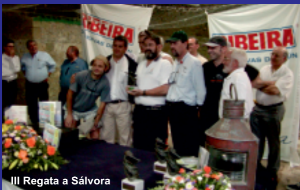
III Regata a Sálvora