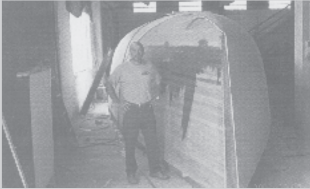
En la foto podemos apreciar la 2ª capa de construcción, colocada en sentido diagonal, de la embarcación "Maroto da Illa"

Queridos socios: Como sabeis, en la reunión de agosto, se propuso la conveniencia de constituir una comisión para la elaboración del proyecto de nuevos Estatutos. Me alegra comunicaros que para dicha comisión ya tenemos 6 voluntarios. No obstante, precisamos vuestra colaboración, y os agradeceríamos que formulaseis cuantas sugerencias creais convenientes en lo relativo a dichos Estatutos, bien por escrito, dirigidos a la Secretaría del Club, bien por correo electrónico.