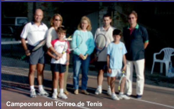
Campeones del Torneo de Tenis