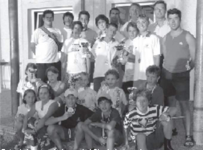
Foto de los premiados en la I Singladurá, en la que aparecen nuestros destacados regatistas acompañados de sus monitores.

Recordamos a todos los socios interesados que continúan las clases de iniciación y perfeccionamiento a la vela todos los sábados y domingos del invierno.