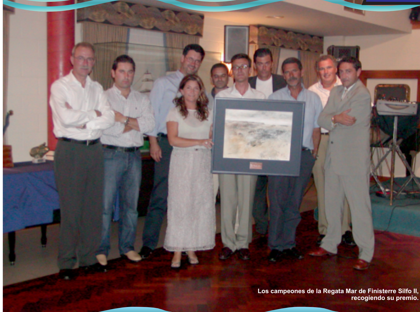
Los campeones de la Regata Mar de Finisterre Silfo II, recogiendo su premio.

Decano de la prensa náutica del Barbanza