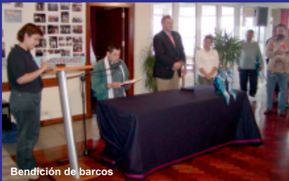
Bendición de barcos