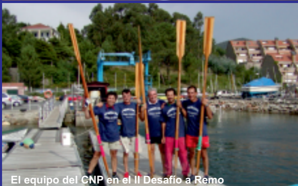
El equipo del CNP en el II Desafío a Remo