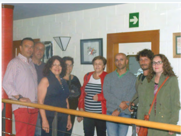
Foto de grupo con los asistentes a la inauguración de la exposición

Las técnicas empleadas por la artista en su obra pictórica abarcan óleo, acrílico y acuarela. Completan su producción artística grabados y esculturas en arcilla.