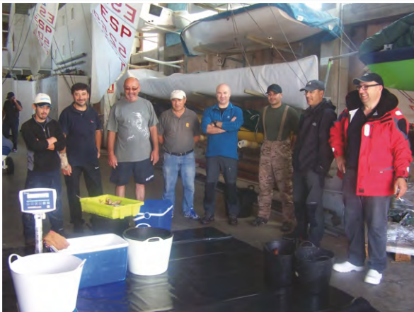
Foto de grupo durante el pesaje