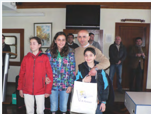
Parte del Equipo de Regatas del RCN Portosín recibiendo las camisetas conmemorativas