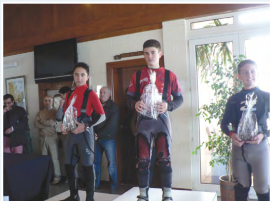
Podium con los tres primeros clasificados del XIII Trofeo Berberecho

Durante el acto de entrega se sortearon 15 vales descuento ofrecidos por North Sails y se entregó una vela de regalo al vencedor cortesía de Velas Pires. El Real Club Náutico Portosín hizo entrega de una camiseta conmemorativa a cada uno de los participantes.