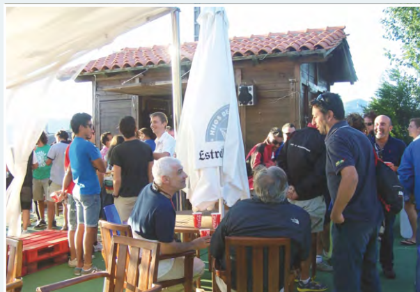
Xurelada del sábado una vez finalizada la Regata Costera de ese mismo día