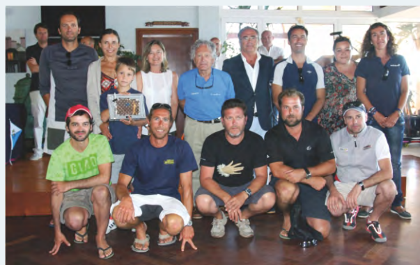
Tripulación del Carolina acompañada por el Vicepresidente de la FGV, representantes de Sailselct y Repsol