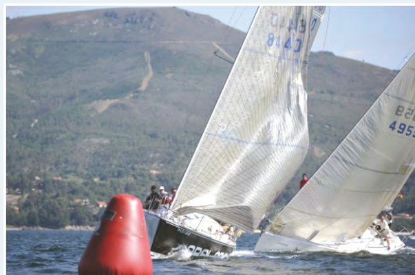
Fotografías tomadas durante el campeonato en las que aparecen el Carolina , Oral Group y Meigas Fóra