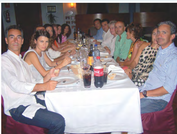
Mesa de la Junta Directiva con familiares y amigos

Intentando alargar lo más posible las vacaciones, la fecha elegida para la celebración de la IV Edición de la Cena de Fin de Temporada organizada por el Real Club Náutico Portosín fue el sábado 30 de agosto. Al igual que en las tres veladas anteriores, antes del baile se procedió a la entrega de trofeos de los torneos organizados por la entidad durante los meses de julio y agosto entre los que destacaron las competiciones de Pesca , Mus y Padel . Después de la entrega, los asistentes terminaron la noche y despidieron agosto al ritmo de la música.